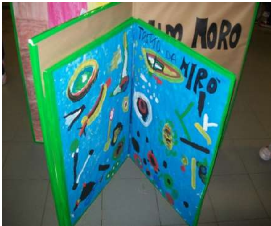
1° sez. collodi